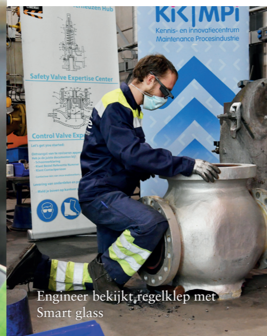
Engineer bekijkt regelklep met Smart glass